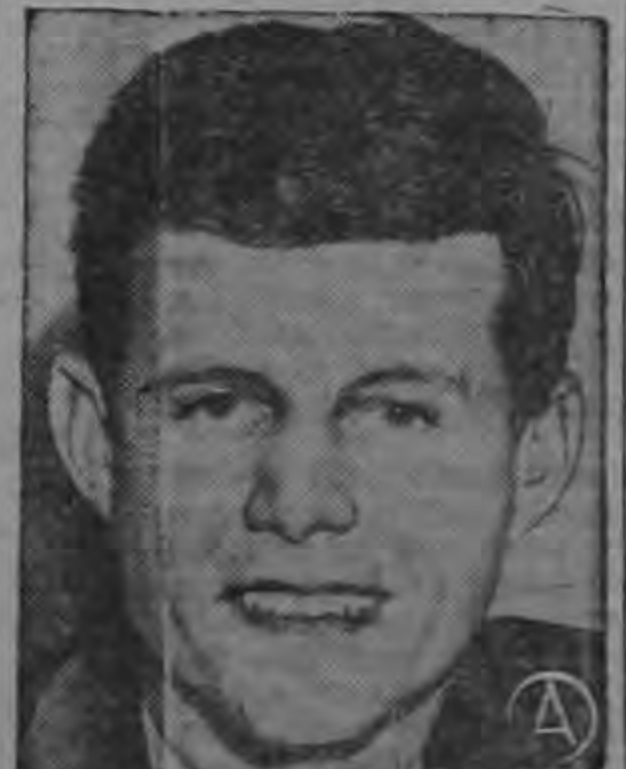
JOHN F. KENNEDY

Por el Presidente de los Estados Unidos de Norteamérica.